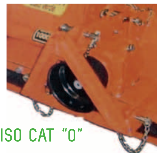
ISO CAT "0"