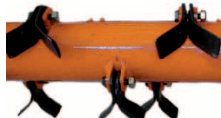
Rotor "Universal Y"